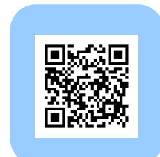
近隣保育施設 保育者